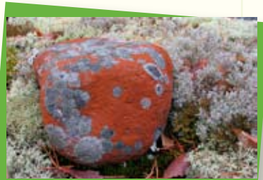
Ihan alhaalla, metsän pohjalla koris-telusta vastaavat sammalet, jäkälät ja levät.